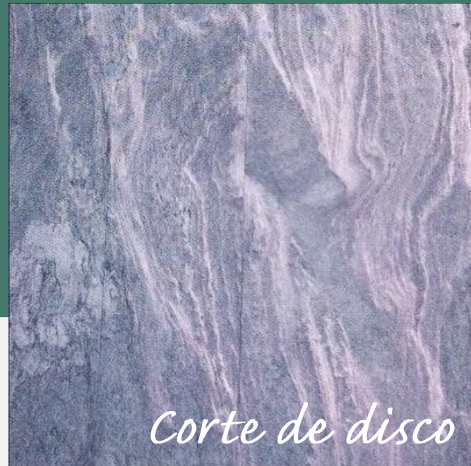
Corte de disco

Imagine una pizarra con una textura, color y resistencia incomparables. Esa es la Filita Cuarzo de nuestras canteras de Bernardos (Segovia), una piedra única que ofrece una extraordinaria libertad en el diseño de piscinas por sus múltiples acabados, impermeabilidad y adherencia.